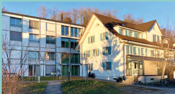
Das Wohnhaus Birkenhof wird neu auch in der Nacht betreut.

Die Vorteile der Nachtbetreuung sind ganz klar da. Bewohnende, die vorher den Bereitschaftsdienst nicht wecken wollten, da sie es gut gemeint haben, können den Nachtdienst jetzt ohne schlechtes Gewissen nutzen. Wir können unseren Klient:innen somit