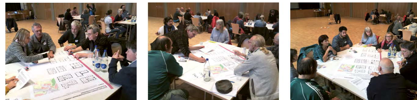
Beteiligungsworkshop «Diagnose» zum Neubauprojekt Kastanienbaum

Im zweiten Workshop «Vision» wurde das Neubauprojekt Ende Januar 2022 (nach Redaktionsschluss) mittels derselben Werte mit den Wünschen und Visionen der Beteiligten ergänzt. Ich bin gespannt, wie sich so die bestehende Projektskizze weiter wandelt Richtung optimale Nutzung und Entfaltung! Das geschärfte Raumkonzept soll dann über die Architekten Edi Meier und Heinz Kündig in die Ausschreibung des Projektwettbewerbs einfließen.