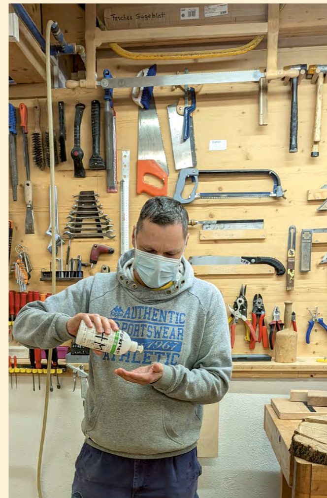
Desinfektionsmittel – ein heute nur allzu bekannter Geruch.