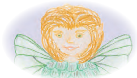
Hallo kleine Elfe Rucka