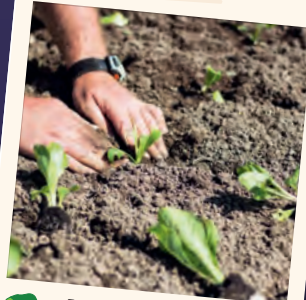
Portulac Individuelle Bepflanzung und Pflege durch Portulac