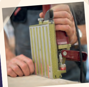
Werkstatt Team Bubikon Hochbeete auf Mass vom WTB

***** Bepflanzt von Portulac sfgb.ch/portulac 043 466 91 44 *****